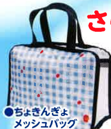
●ちよきんぎょ メッシュバッグ