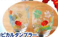
●虫とって ちよきんぎょ